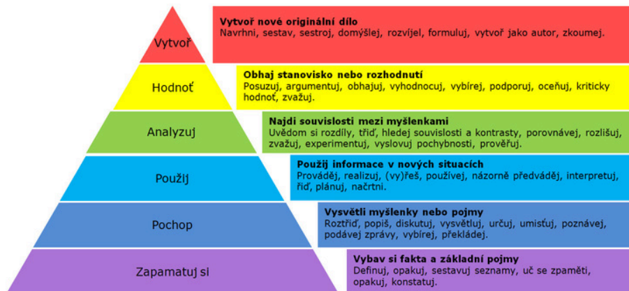
Obrázek 1: Bloomova taxonomie

Zahrneme do nich identifikované složky kompetence. Pro formulaci výstupů je užitečným nástrojem Bloomova taxonomie (Obrázek 1).